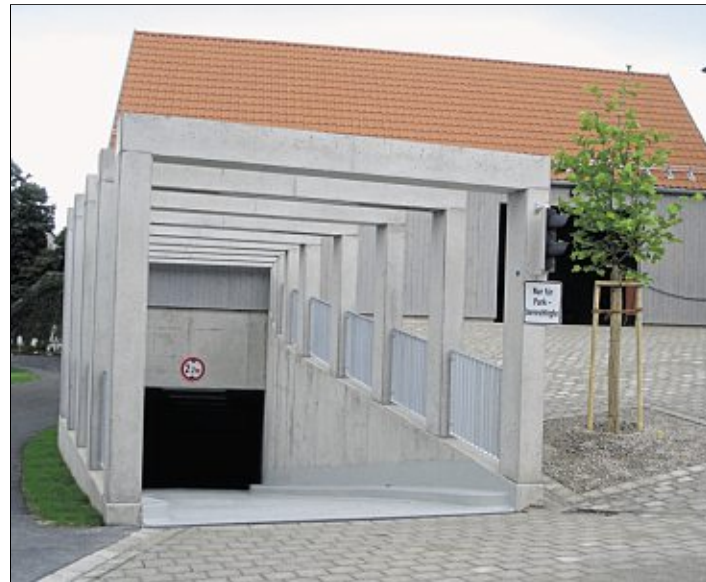
Der Eingangsbereich der neuen Tiefgarage.

Neue Tiefgarage beim Landratsamt in Neustadt/WN wird heute um 15 Uhr feierlich eröffnet – Rund zwei Millionen Euro Gesamtkosten