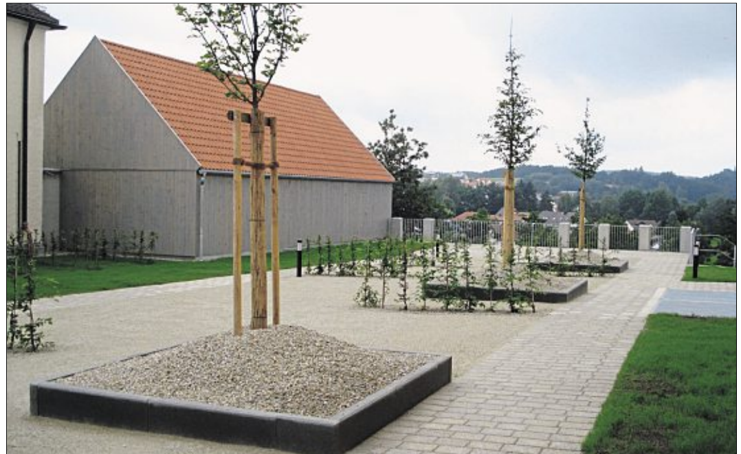
Das Dach der Tiefgarage ist auch optisch vollends gelungen.

Insgesamt entstanden so 44 Stellplätze auf zwei Ebenen, wovon 22 bereits fest vermietet sind. Um die Autofahrer zu locken, wurde die Parkzeit im Gegensatz zum Stadtplatz auf zwei Stunden ausgeweitet. Im Freien, gegenüber dem Landkreissied-